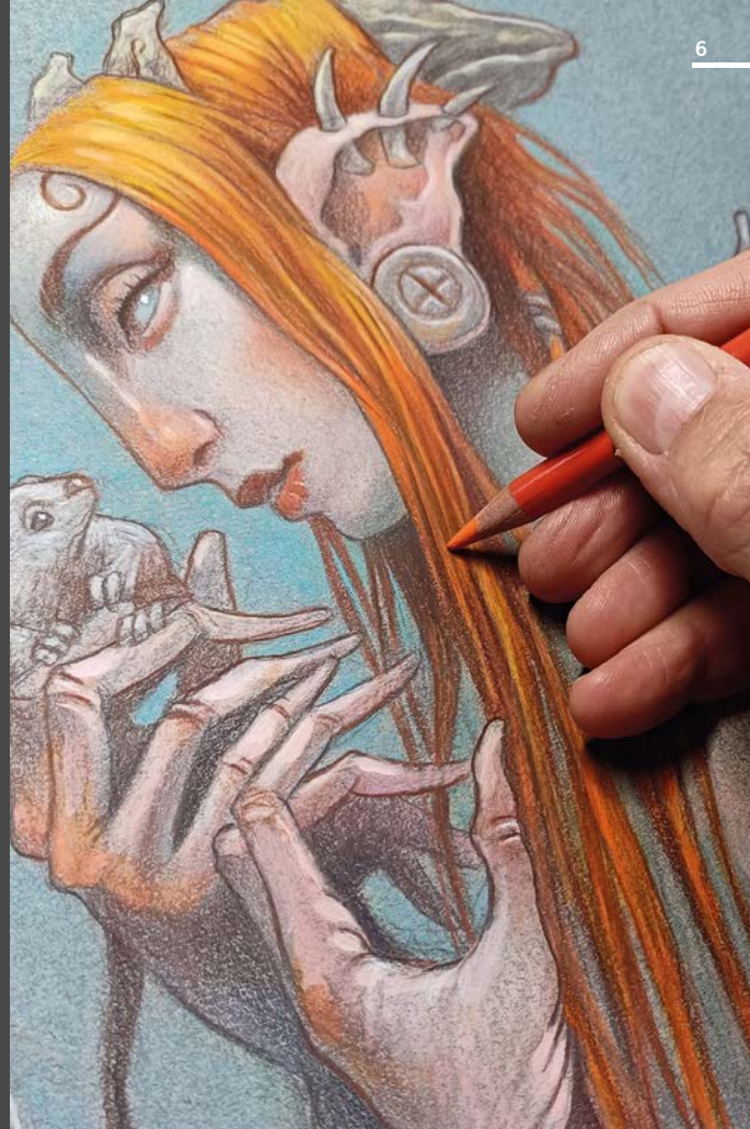
Ilustración de Max Hierro

Las nuevas tecnologías y los sistemas de comunicación como las redes sociales, llevan abriendo desde hace años vías para transmitir nuestro trabajo a cualquier parte del mundo, creando profesiones nuevas y ampliando considerablemente las ofertas y posibilidades laborales.