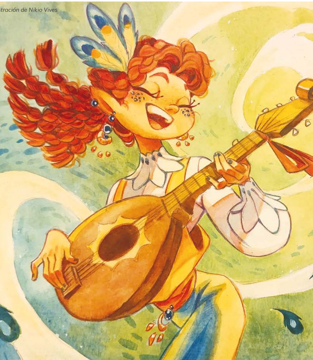
Ilustración de Nikio Vives

Estos precios incluyen los materiales para los ejercicios realizados en el Centro en la modalidad Presencial.