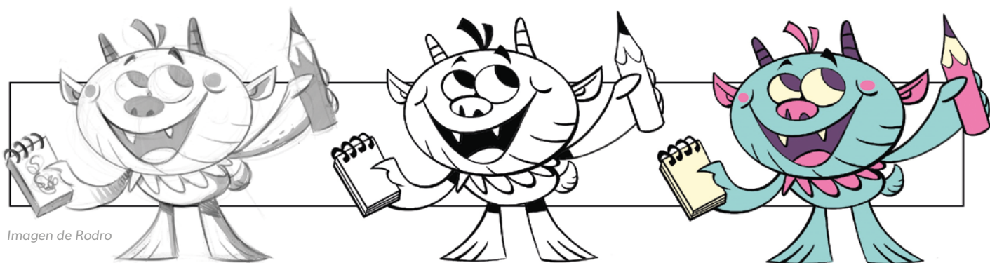
Imagen de Rodro

Desde un punto de vista pedagógico, aprenderás qué libros conectan mejor con el lector infantil y las razones de ello. Conocerás el mercado de libros infantiles, empresas editoriales y cómo funciona la autopublicación, así como las diferencias entre el mercado europeo y el americano. También descubrirás todos los recursos y medios de los que puedes disponer para dar a conocer tu trabajo de la mejor forma posible, y buscar soluciones prácticas para conectar con el público al que irá destinado tu libro.