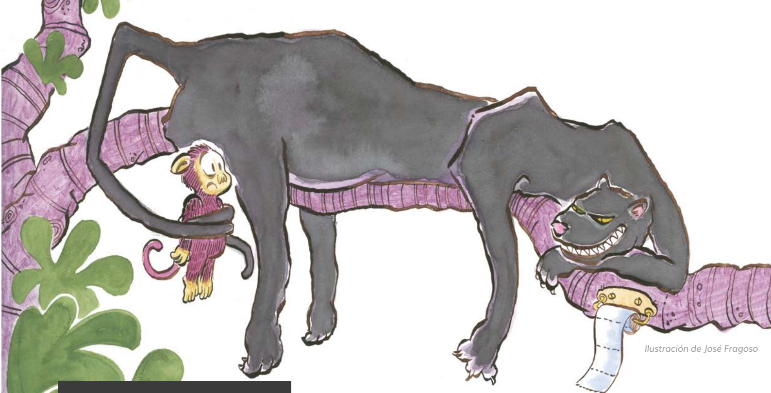
Ilustración de José Frago