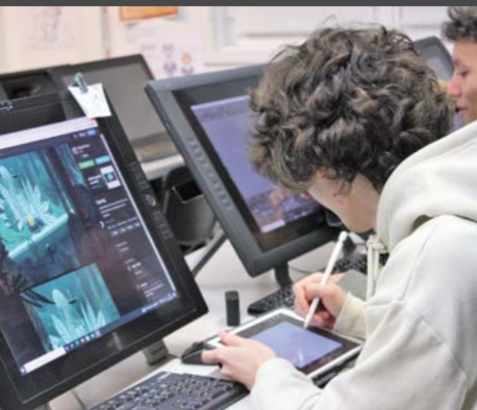
Alumnos en la productora de animación de ESDIP

Además de la bolsa, siendo estudiante de ESDIP, siempre contarás con asesoramiento personal para ayudarte, por ejemplo, a realizar una entrevista de trabajo, a preparar tu portafolio o a mejorar tus redes sociales.