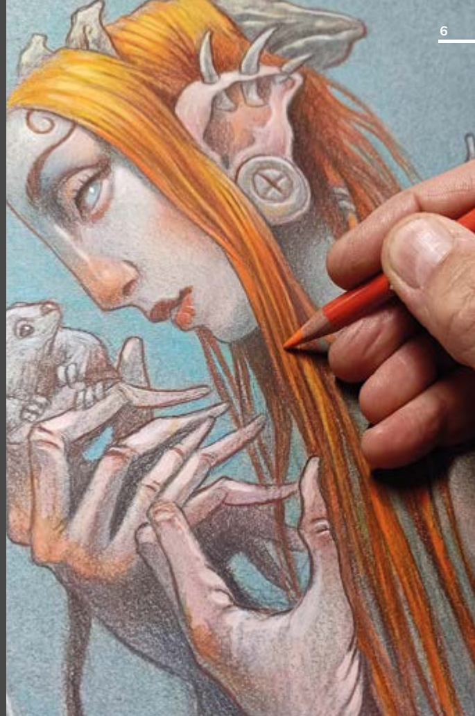
Ilustración de Max Hierro

Las nuevas tecnologías y los sistemas de comunicación como las redes sociales, llevan abriendo desde hace años vías para transmitir nuestro trabajo a cualquier parte del mundo, creando profesiones nuevas y ampliando considerablemente las ofertas y posibilidades laborales.