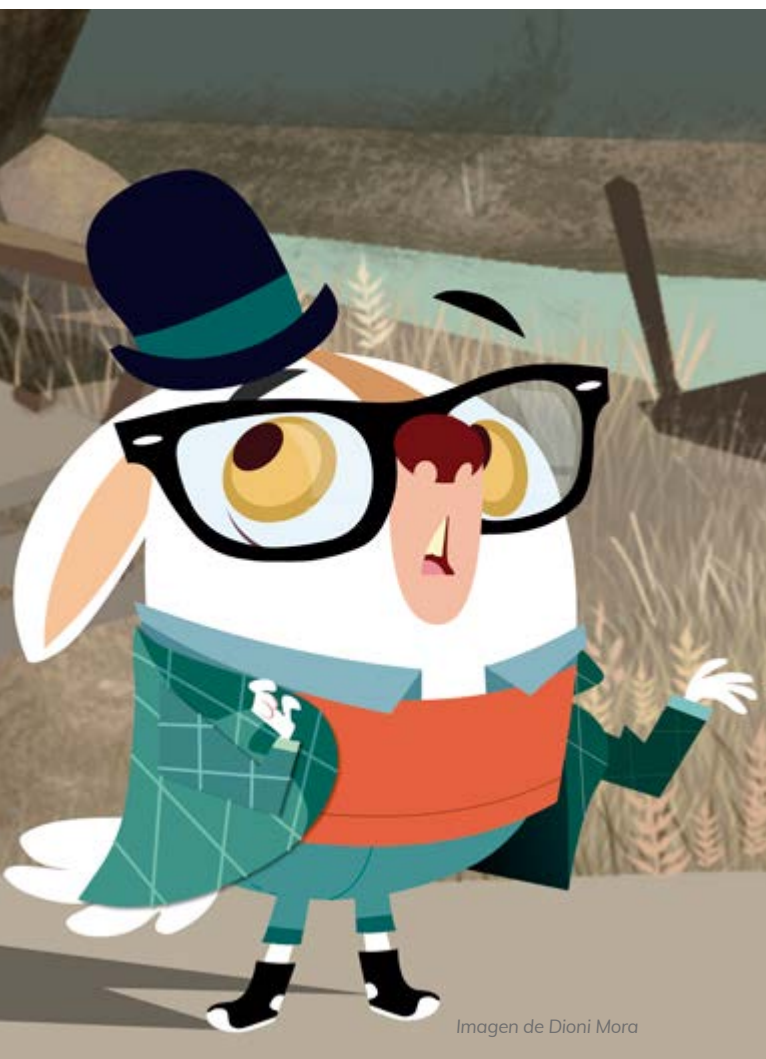
Imagen de Dioni Mora