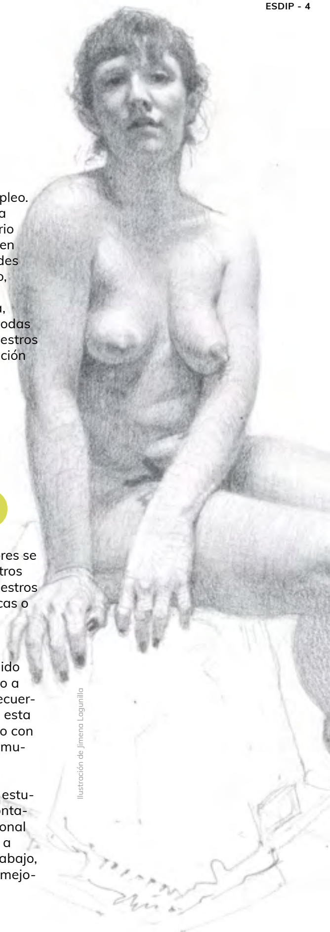
Ilustración de Jimena Logunilla

Además de la bolsa, siendo estudiante de ESDIP, siempre contarás con asesoramiento personal para ayudarte, por ejemplo, a realizar una entrevista de trabajo, a preparar tu portafolio o a mejorar tus redes sociales.