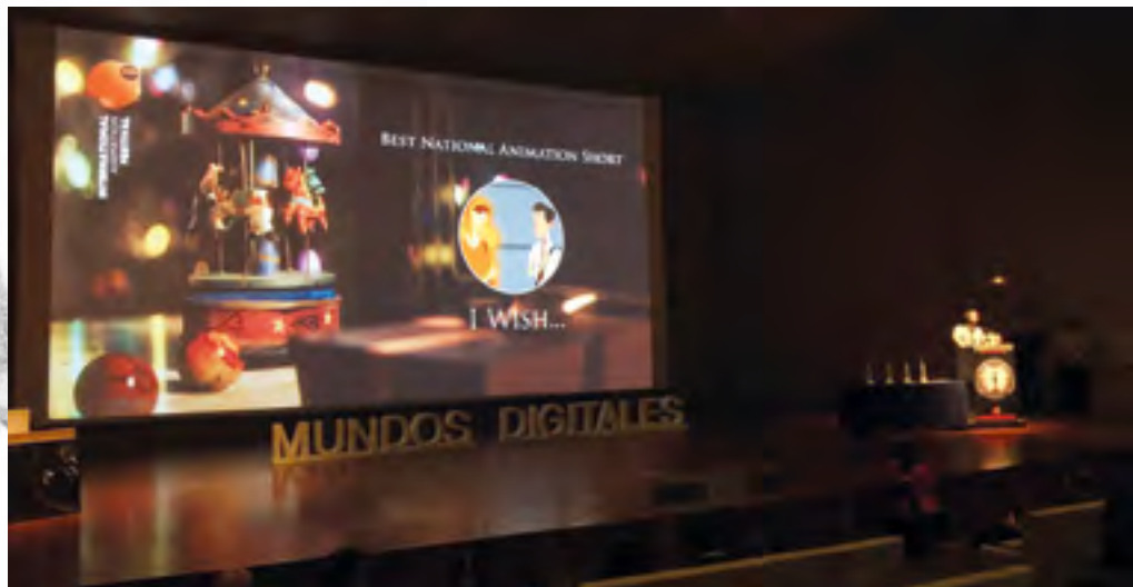
Nuestros cortos son premiados