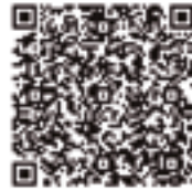
DIBUJANTE DE CÓMICOS