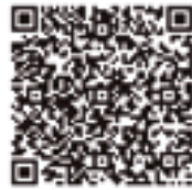
STORYBOARD Y ANIMADOR