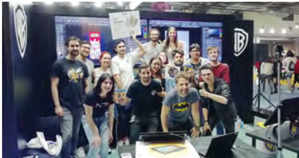
Eventos de colaboración con empresas