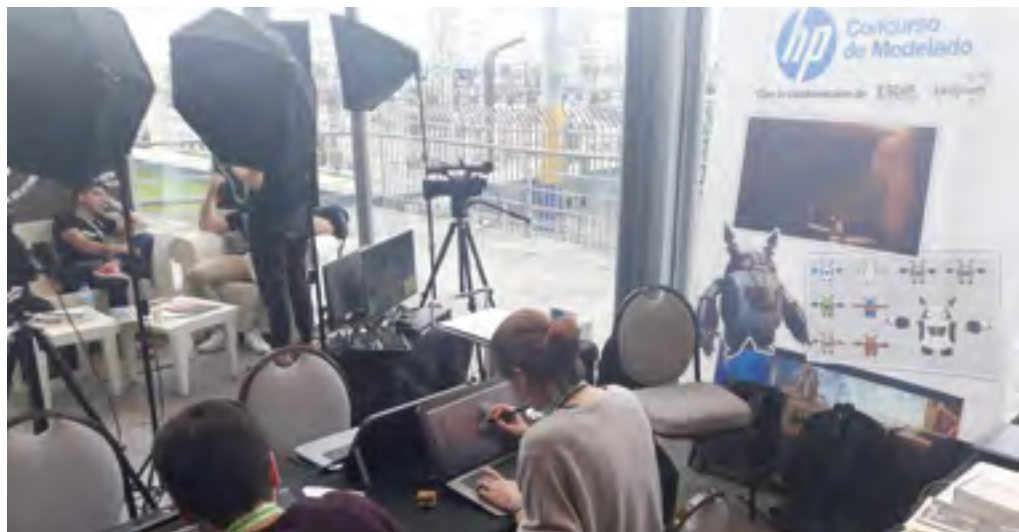
Eventos de colaboración con empresas