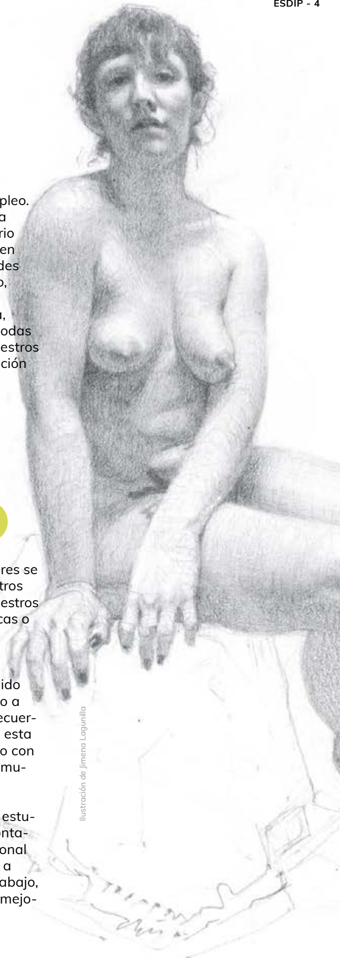
Ilustración de Jimena Logunilla

Además de la bolsa, siendo estudiante de ESDIP, siempre contarás con asesoramiento personal para ayudarte, por ejemplo, a realizar una entrevista de trabajo, a preparar tu portafolio o a mejorar tus redes sociales.