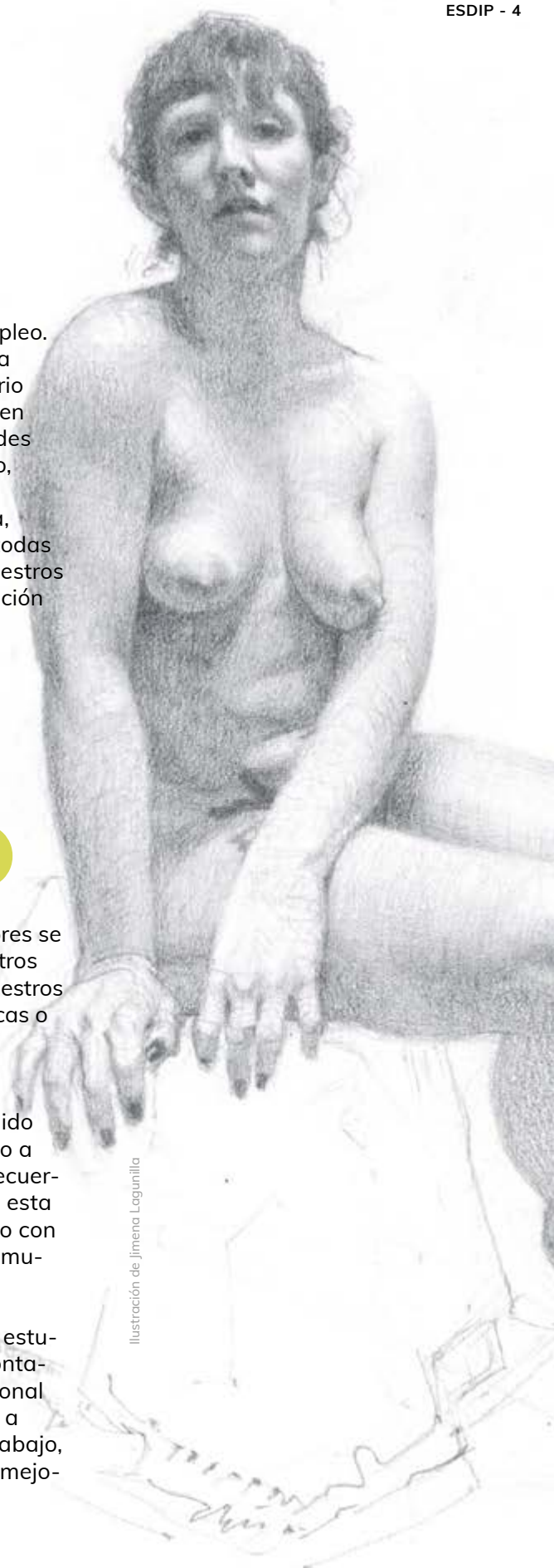
Ilustración de Jimena Logunilla

Además de la bolsa, siendo estudiante de ESDIP, siempre contarás con asesoramiento personal para ayudarte, por ejemplo, a realizar una entrevista de trabajo, a preparar tu portafolio o a mejorar tus redes sociales.