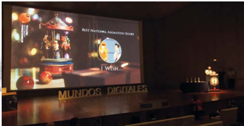
Nuestros cortos son premiados