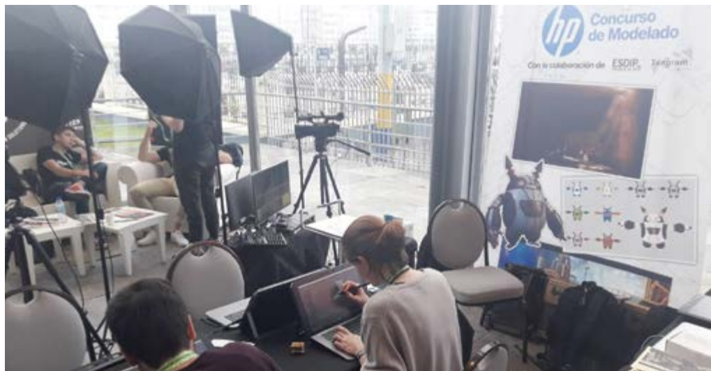
Eventos de colaboración con empresas