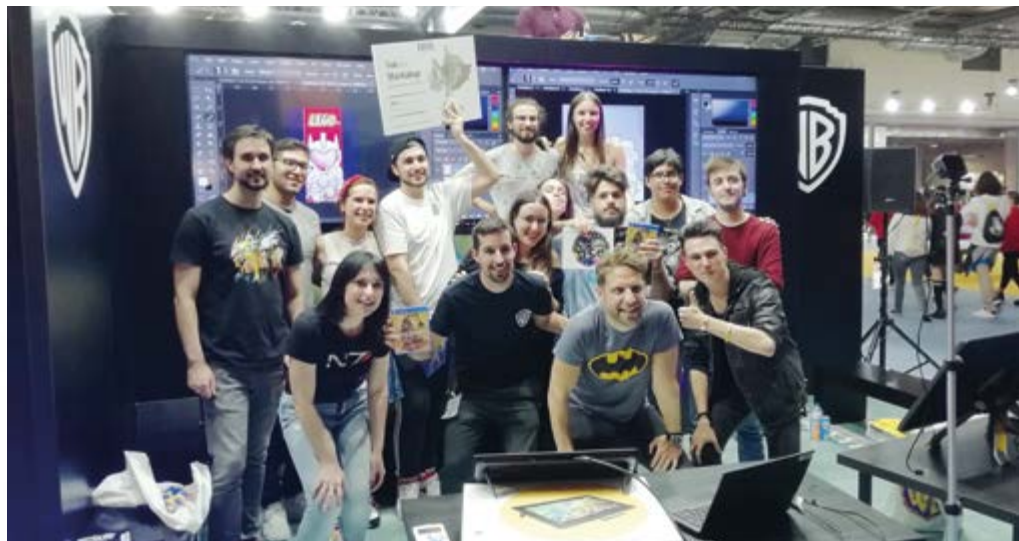
Eventos de colaboración con empresas