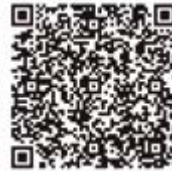
DIBUJANTE DE CÓMICOS