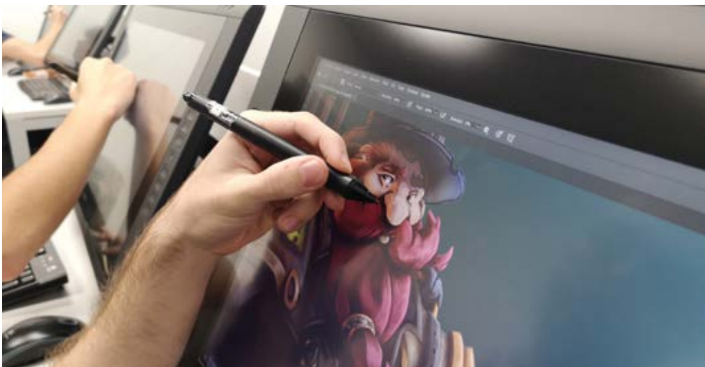
Clase de ilustración digital de ESDIP.