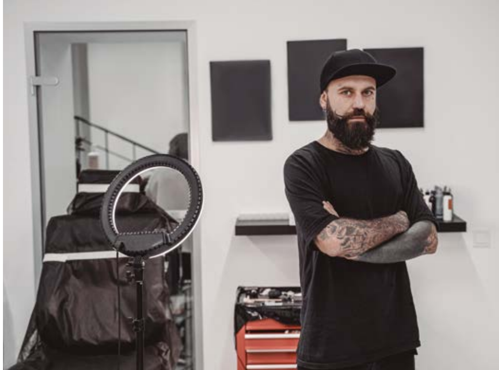
Tatuador en su estudio.

La comunicación y la imagen serán durante este siglo la mayor fuente de oferta laboral en todo el mundo. Tu labor profesional como artista gráfico consistirá, principalmente, en comunicar con imágenes y transmitir mediante dibujos, ilustraciones, diseños, animaciones, pinturas, grabados, etc, propuestas personales o por encargo de otros como editoriales, prensa, publicidad, cine, teatro, televisión, Internet, etc.