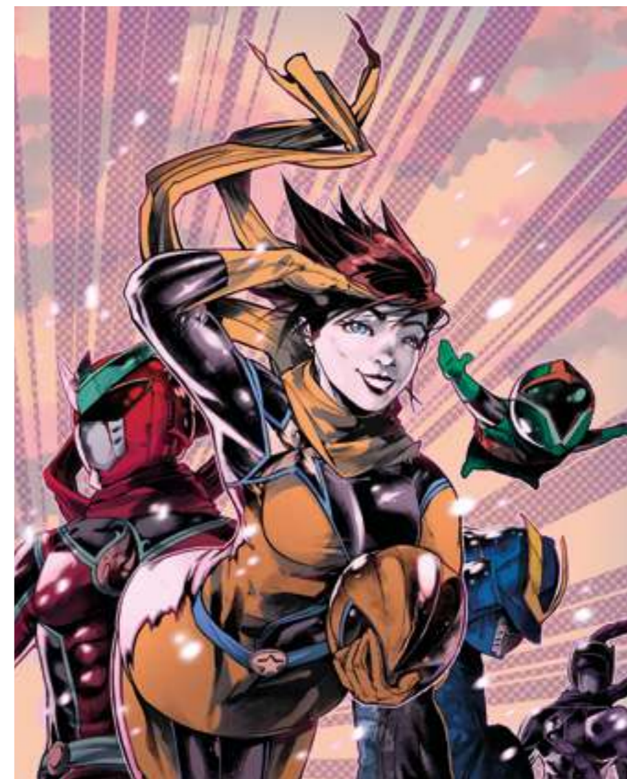
Hugo de Juan

Narrativa, elipsis, desarrollo de un cómic con guión del alumno, diseño de los personajes principales, guión, estructura básica; planteamiento, nudo y desenlace; puntos de inflexión, planos, viñetas, diálogos, bocadillos flashback, narración en off, splash-page, acción, ambientación, narrativa dramática, clímax, epílogo, portada, entintado: línea, trama y mancha, realización de cómics en diversos estilos. Entintado avanzado, adaptación de un retrato al cómic, creación de personajes, guión avanzado: subtramas, giros, ritmos, acabados, rotulación, maquetación y arte final.