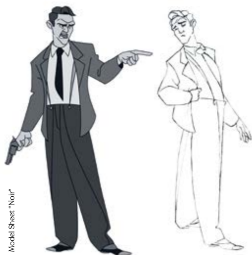
Model Sheet "Noir"