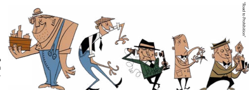
"Road to Prohibition"