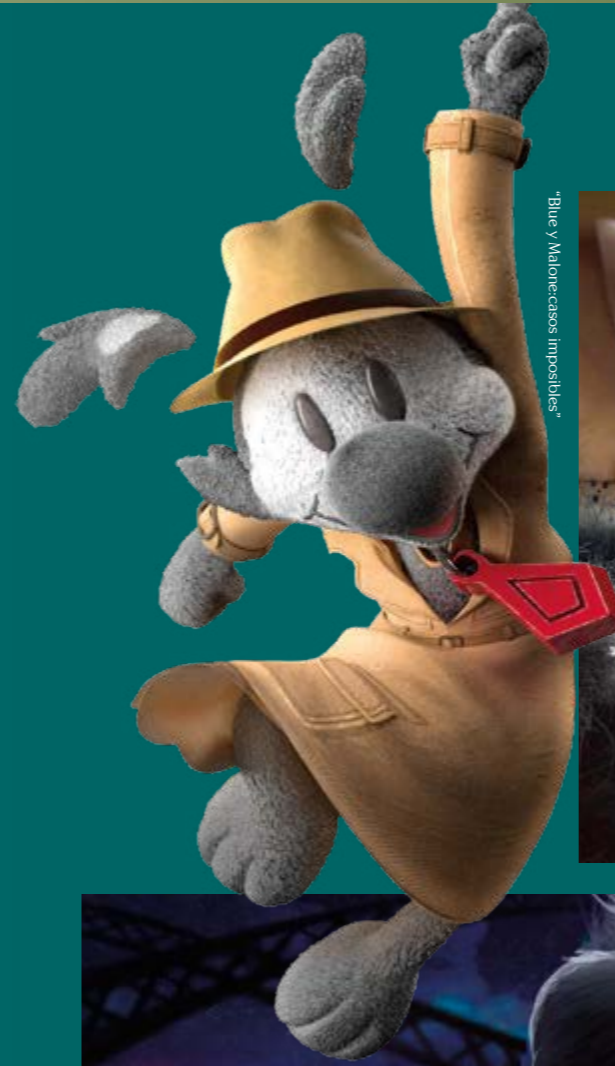
"Blue y Malorecasos imposibles"