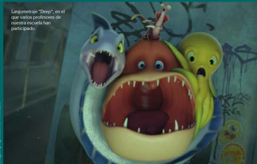
Largometraje "Deep", en el que varios profesores de nuestra escuela han participado.