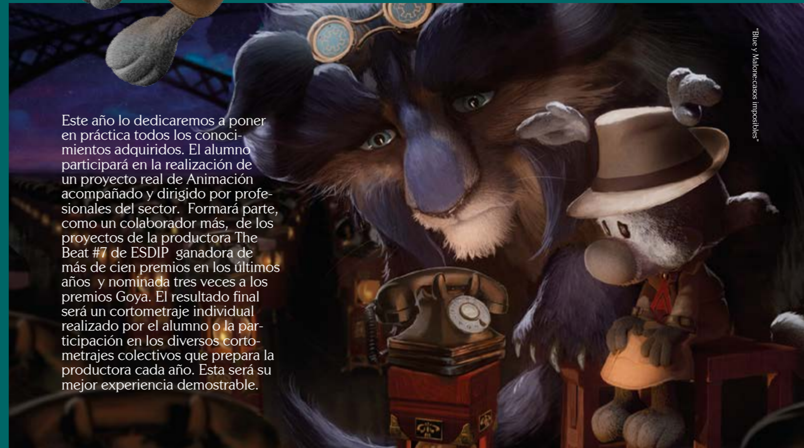
"Blue y Malorecasos imposibles"

Este año lo dedicaremos a poner en práctica todos los conocimientos adquiridos. El alumno participará en la realización de un proyecto real de Animación acompañado y dirigido por profesionales del sector. Formará parte, como un colaborador más, de los proyectos de la productora The Beat #7 de ESDIP ganadora de más de cien premios en los últimos años y nominada tres veces a los premios Goya. El resultado final será un cortometraje individual realizado por el alumno o la participación en los diversos cortometrajes colectivos que prepara la productora cada año. Esta será su mejor experiencia demostrable.