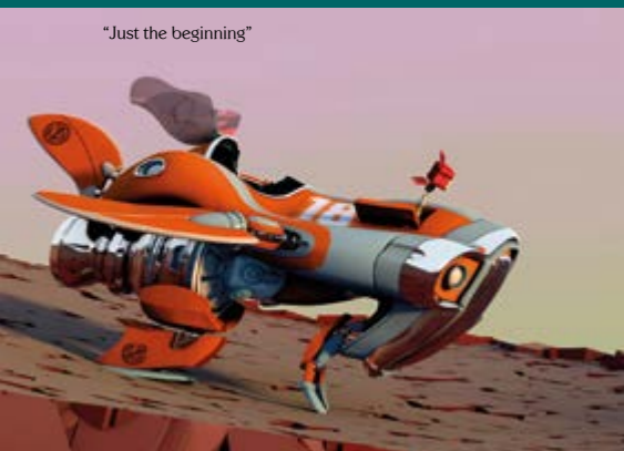
"Just the beginning"