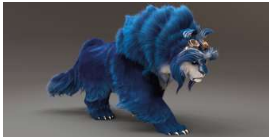
Imagen de la producción "Blue y Malone"