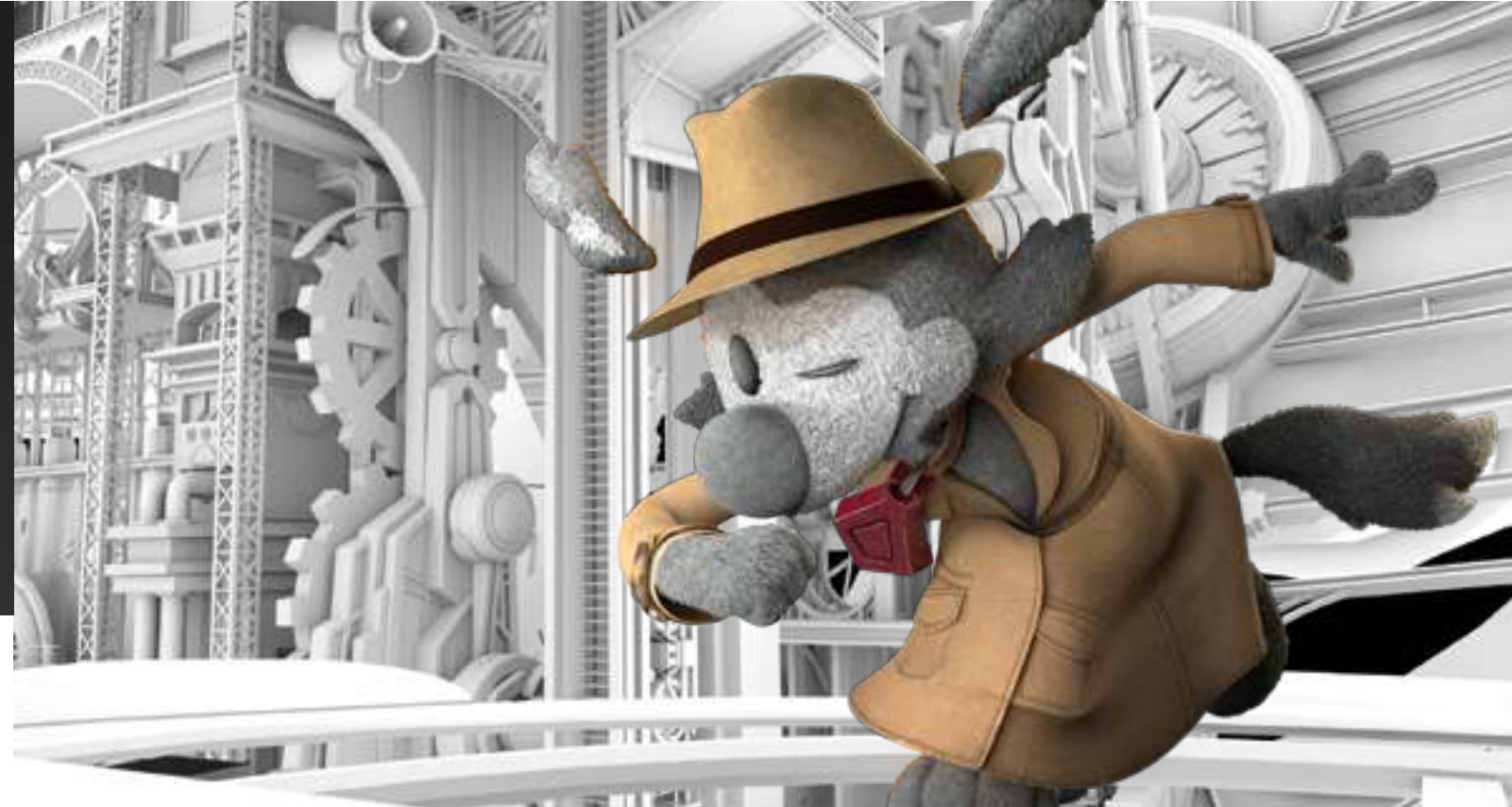
Imagen de la producción "Blue y Malone"