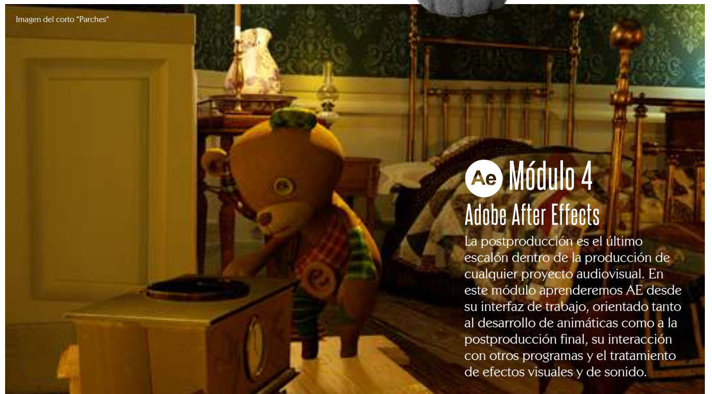
Imagen del corto "Parches"