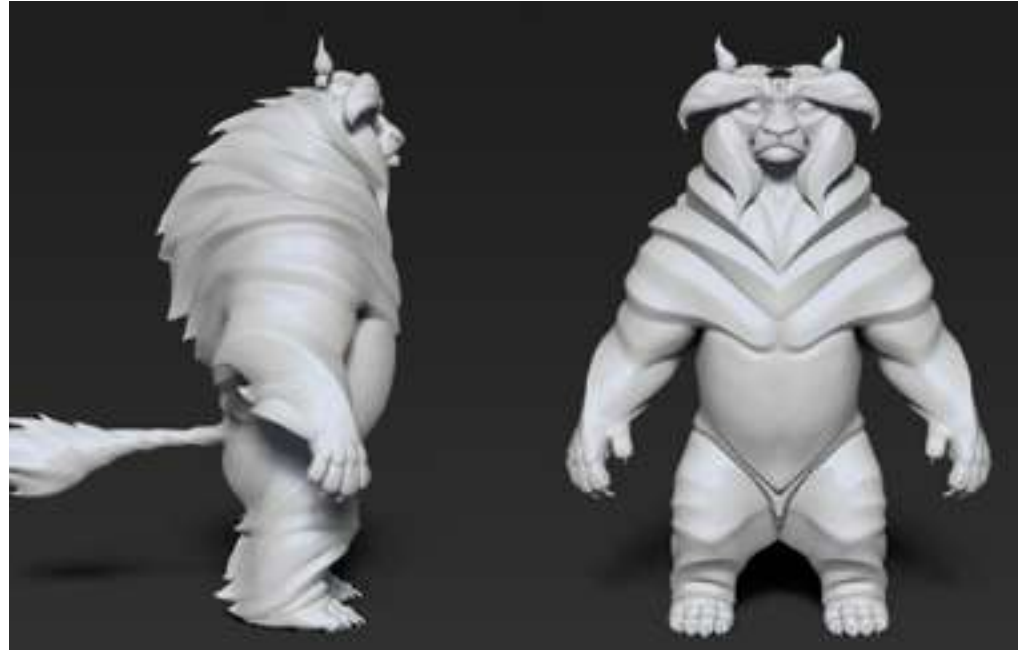
Imagen de la producción "Blue y Malone"

Z-Brush se ha convertido en un standard dentro del modelado de personajes y assets en 3D. Este módulo afronta el software desde un punto de vista práctico: no sólo como herramienta para esculturas estáticas, sino también para su integración en Maya. Realizaremos bustos humanos, alienígenas, un cuerpo humano completo, retopología, hard surface (assets, props y escenarios) y animales realistas y fantásticos.